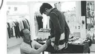
所属のコースでも販売中で、腰痛ゴルファーに好評だという