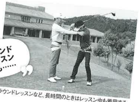
ラウンドレッスンなど、長時間のときはレッスン中も着用する