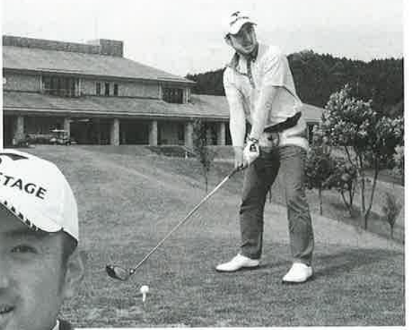
骨盤が安定するので、アドレスもきっちり決まる。飛距離アップにも貢献するという