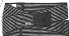
スタンダード 家にいながらタイプ 税込価格 8925円