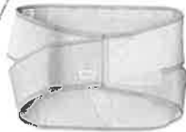
アスリート向け スポーツやりながらタイプ ページ 税込価格 9975円

「THE骨盤」シリーズ 多くのプロやドクターも推薦。ゴルフ後の疲労、腰痛を予防する骨盤矯正ベルト。自宅でつけるだけで骨盤を正しい位置へと導いてくれる。