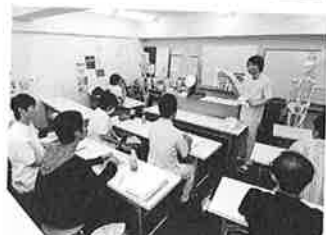
▲学科では、解剖生理学、東洋経絡論、臨床学、診断学、リフレクソロジー-反射学などを学ぶ