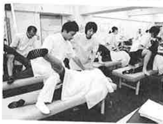
▲ストレッチはもちろん、全身調整、カイロ、臨床、矯正など幅広い実技もマスターできる