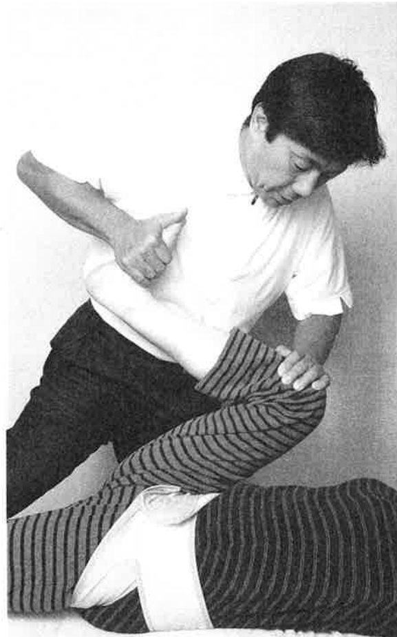
日本オリンピック委員会強化スタッフ (医・科学スタッフ)