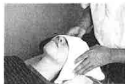
眼精ケア 頭と目のまわりの筋肉やつぼを押し、目の疲れをとる。肩こり解消にも効果的