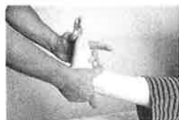
足つぼ刺激 足全体をほぐしたあとで、足裏を棒で押す。クセになるイタ気持ちよさが人気