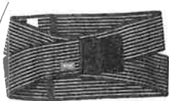
スタンダード 家にいながらタイプ 税込価格 8925円