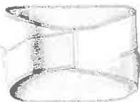
アスリート向け スポーツやしながらタイプ ベージュ 税込価格 9975円