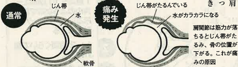
左肩を頭の上から見た図