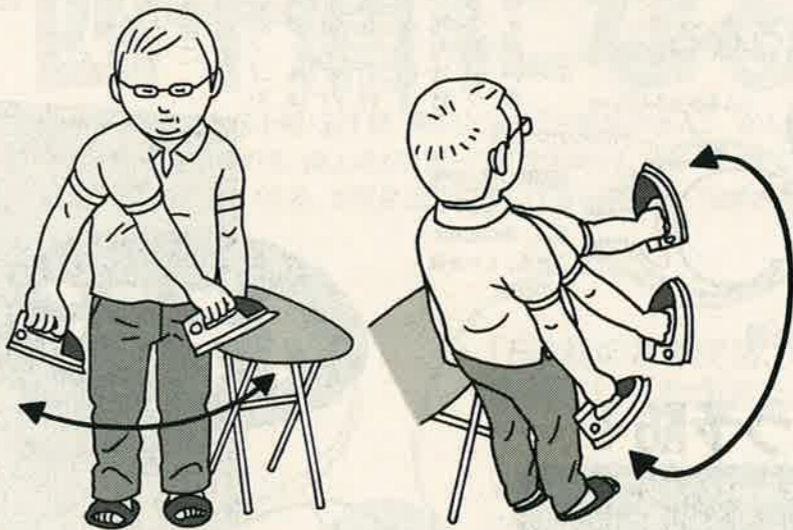
アイロンを痛み側の手に持ち、肩の力を抜き左右に動かす