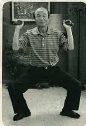
毎日30分間、ダンベルを上げたり下げたりしている

身体を鍛えるというより、筋肉が固くならないように肩関節の柔軟性を意識したものです。毎朝30分、ダンベル体操をしています。四肢を踏みながらの上下運動で肩の可動域も広がりました。