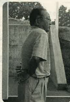
両腕を腰にあて、肩甲骨を意識しながら、胸を張ったり閉じたりしている

ゴルフの練習中に五十肩になり、しばらく痛くてゴルフはプレーできませんでした。ところが、毎食後必ず行う5分間の肩甲骨運動で肩の可動域が広がり飛距離もアップしました。